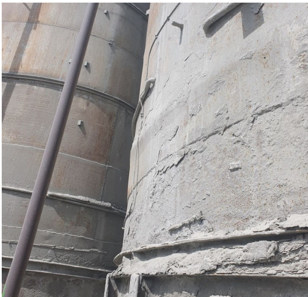
Рисунок 3 – Коррозия металла элементов усиления, местная потеря устойчивости стенки и окаменевшие отложения цемента в опорной части

Кроме этого, на перекрытии подсилосного пространства и снаружи обнаружены большие скопления слежавшегося цемента.