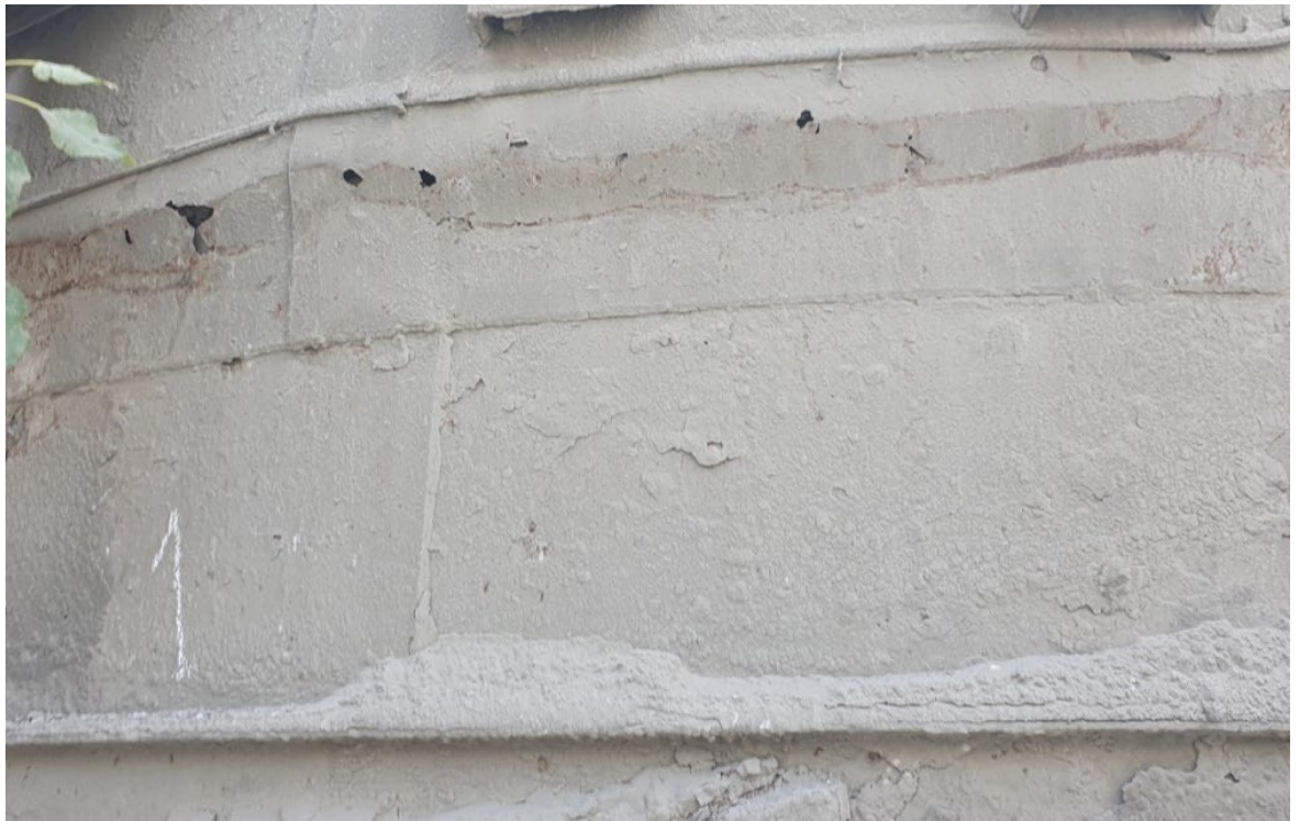
Рисунок 4 – Местная потеря устойчивости стенки опорной части в местах ослабления сечения вследствие коррозии металла, сквозные отверстия

Кроме опасности разрушения строительных конструкций силосов, их разгерметизация приводит к большим экономическим потерям: снижению вязущих и прочностных свойств цемента, увеличению нагрузки от слежавшегося (неиспользуемого) слоя.