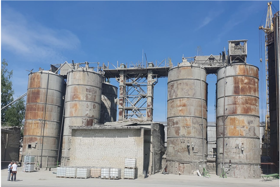
Рисунок 2 – Общий вид силосов

Общая высота отдельно стоящего силоса 17.2 м, диаметр 5.8 м, высота усеченного конуса 5 м. В опорной части цилиндра расположены квадратные проемы размером 1.9x1.9 м. Толщина стенки цилиндрической оболочки 8 мм. Устойчивость вертикального положения бункера обеспечивается стальными распорками, прикрепленными к опорной цилиндрической оболочке выше ж.б. перекрытия подсилосного пространства.