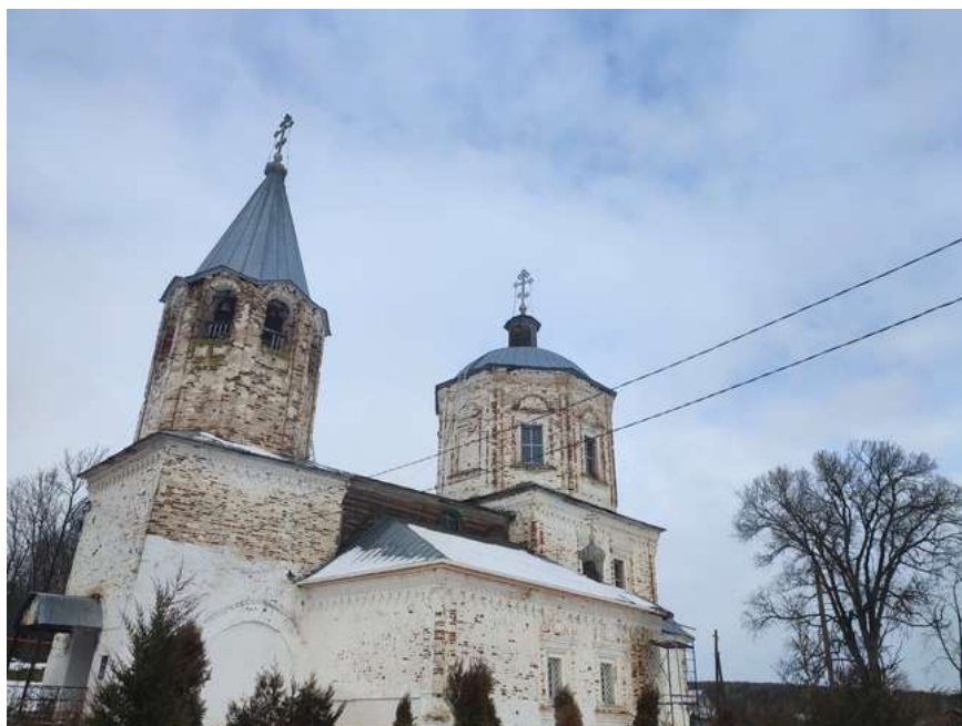
Рисунок 1 – Общий вид церкви

При инженерно-техническом обследовании церкви в рамках предпроектных работ специализированной организацией [8,9] по согласованию с собственником ОКН было выявлено: