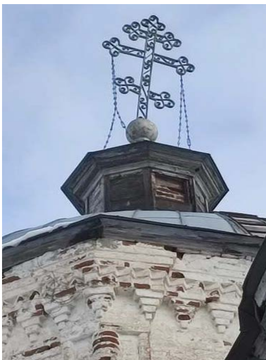
Рисунок 2 – Крен креста