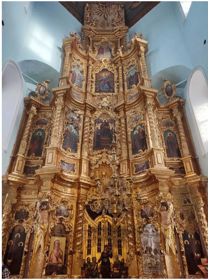
Рисунок 5 – Состояние алтаря здания

Предусматривается усиление конструкций купола (рис.6,7) путем усиления барабана купола и замены части деревянных конструкций купола.