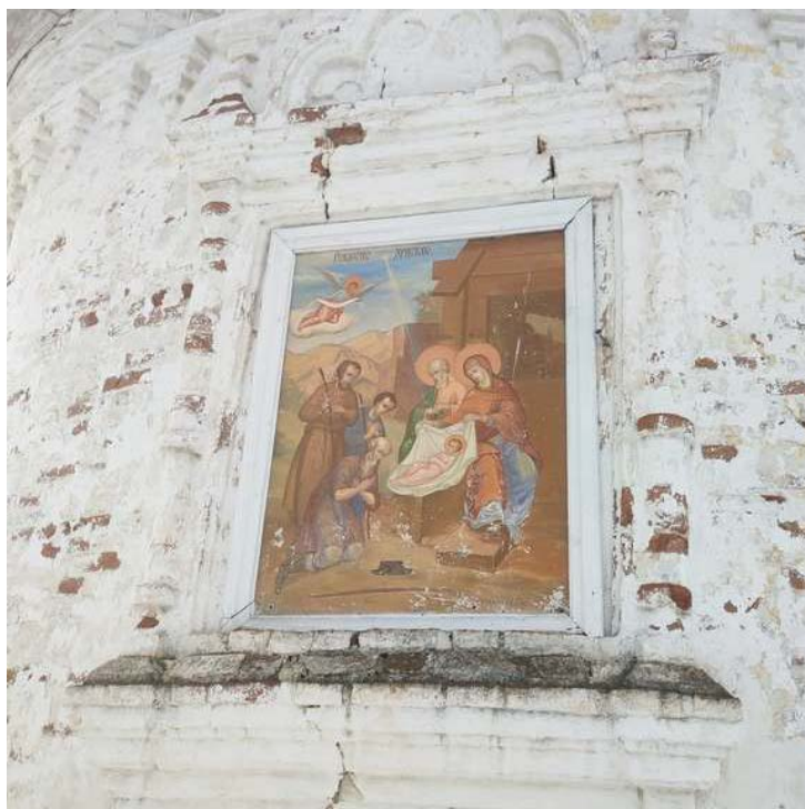
Рисунок 3 – Трещины фасада здания

На момент обследования конструктивные элементы церкви находятся в ограниченно работоспособном состоянии, а отдельные - в аварийном при существенном уменьшении безопасности прихожан и служителей культа. Существует реальная угроза падения креста с разрушением части купола и алтаря в здании (рис.4) [11].