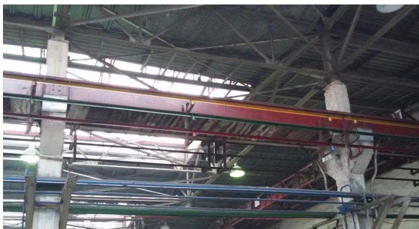
Рисунок 2 - Типовая подкрановая балка пролётом 6 м

Особое внимание уделялось подкрановым балкам. Металлические подкрановые балки разрезные пролётом 6 м выполнены из прокатного двутавра. В крайних рядах они снабжены крановыми упорами. На опорах балки соединяются накладками на болтах. Высотные отметки балок регулируются на опорах стальными прокладками. В качестве кранового рельса используется прокатный квадрат сечением 60x60 мм. Общий вид типовой балки представлен на рис.2.