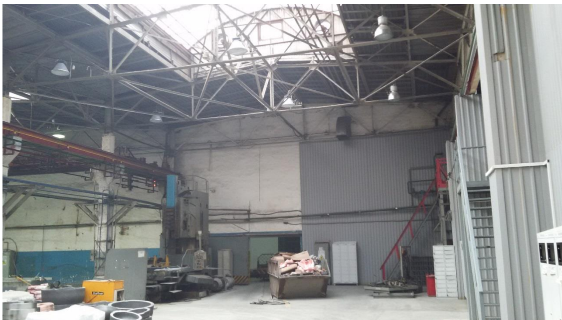
Рисунок 1 - Общий вид цеха

Особое внимание уделялось подкрановым балкам. Металлические подкрановые балки разрезные пролётом 6 м выполнены из прокатного двутавра. В крайних рядах они снабжены крановыми упорами. На опорах балки соединяются накладками на болтах. Высотные отметки балок регулируются на опорах стальными прокладками. В качестве кранового рельса используется прокатный квадрат сечением 60x60 мм. Общий вид типовой балки представлен на рис.2.